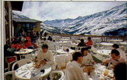
Pause-déjeuner au club Aquarius. Dans la station, un organisme prend en charge les enfants : cours, goûter...